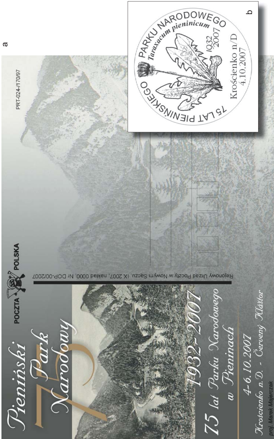
Ryc. 2. Druki okolicznościowe z okazji 75-lecia Pienińskiego Parku Narodowego i 40-lecia Pienińskiego narodnego parku (PIENAP): a – karta pocztowa; b – stempel pocztowy (Proj. M. Majerczak) Occasional prints to celebrate the 75 th anniversary of the Pieniny National Park in Poland and the 40 th anniversary of the Pieniny National Park in Slovakia (PIENAP): a – a postcard; b – a date stamp. (designed by M. Majerczak)