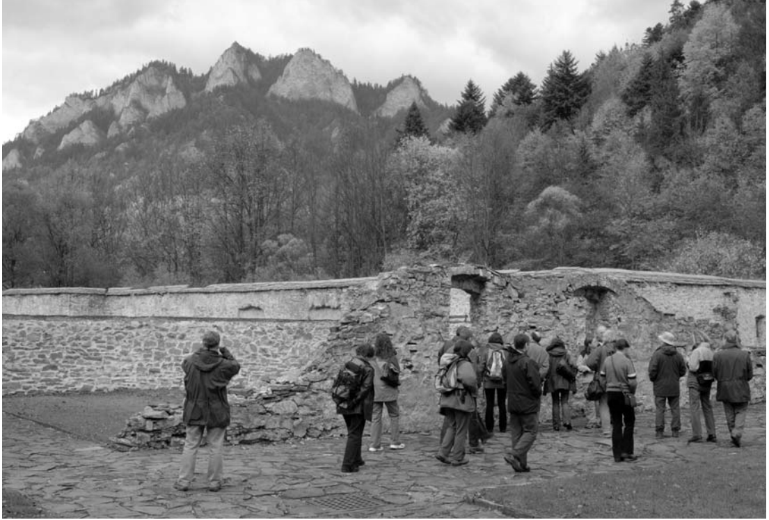
Fot. 12. Zwiedzanie Czerwonego Klasztoru. A visit to Czerwony Klasztor (the Red Monastery) in Slovakia.

poruszył problematykę zabudowy Nowych Maniów i Kluszkowiec jako skrajnych przykładów dewastacji krajobrazu obcą, bo wywodzącą się z nizin, formą zabudowy.