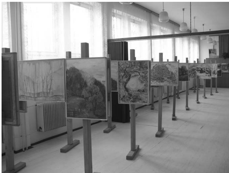
Fot. 1. Wystawa prac malarskich słowackiej i polskiej młodzieży w holu Domu Kultury w Spiskiej Starej Wsi.

An exhibition of paintings by teenagers from Slovakia and Poland presented in the hall of the Community Centre in Spiska Stara Wieś.