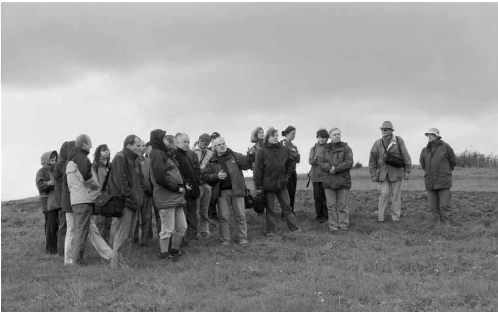
Fot. 10. Uczestnicy wycieczki terenowej w Krośnicy. Field trip participants in Krośnica.