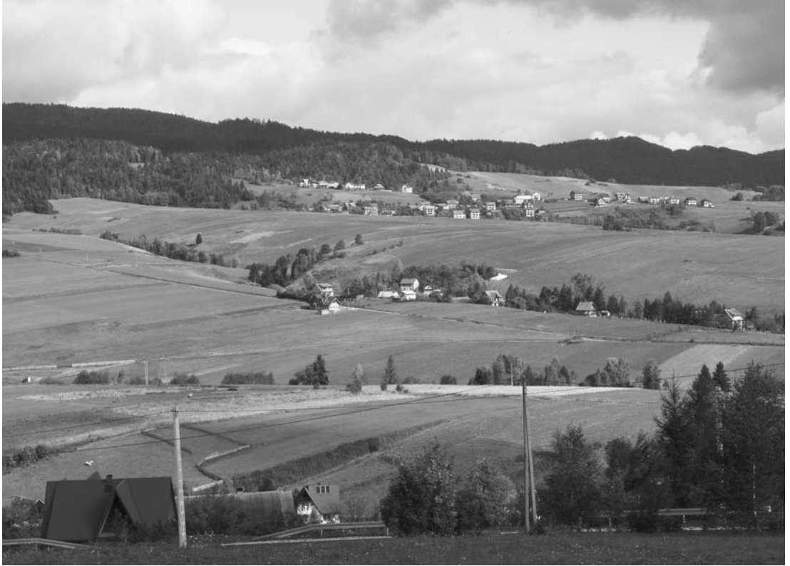
Fot. 11. Chaotyczna rozbudowa i zatarcie historycznej formy osiedleńczej Krośnicy i Grywałdu. (Fot. K. Karwowski). Scattered development caused transformation of the historical pattern of settlements in Krośnica and Grywałd. (Phot. K. Karwowski)

(Fot. 10). Inna grupa, pomimo niesprzyjającej pogody, wybrała się na spływ Dunajcem słowacką tratwą.