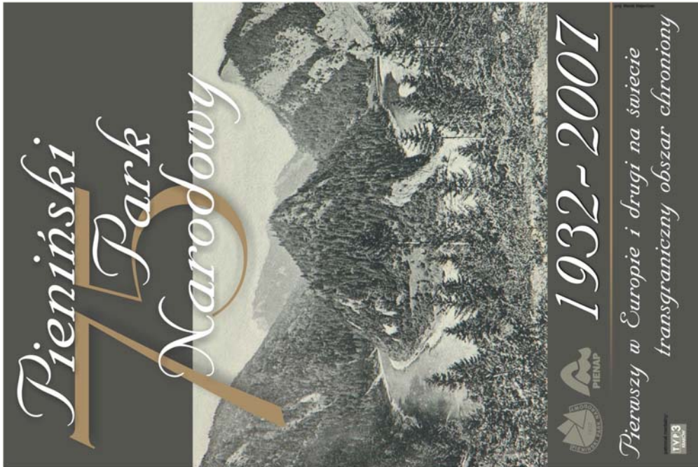
Ryc. 1. Okolicznościowe plakaty z okazji 75-lecia Pienińskiego Parku Narodowego i 40-lecia Pieninskiego narodnego parku (PIENAP). (Proj. M. Majerczak). Occasional posters to celebrate the 75 th anniversary of the Pieniny National Park in Poland and the 40 th anniversary of the Pieniny National Park in Slovakia (PIENAP). (Designed by M. Majerczak)