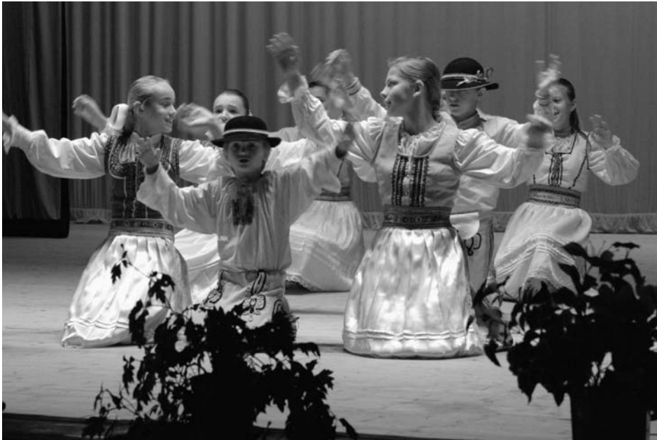
Fot. 4. Występ ludowego zespołu dziecięcego „Flisoczek” z Czerwonego Klaszoru. A performance by a children group “Flisoczek” from Czerwony Klasztor.