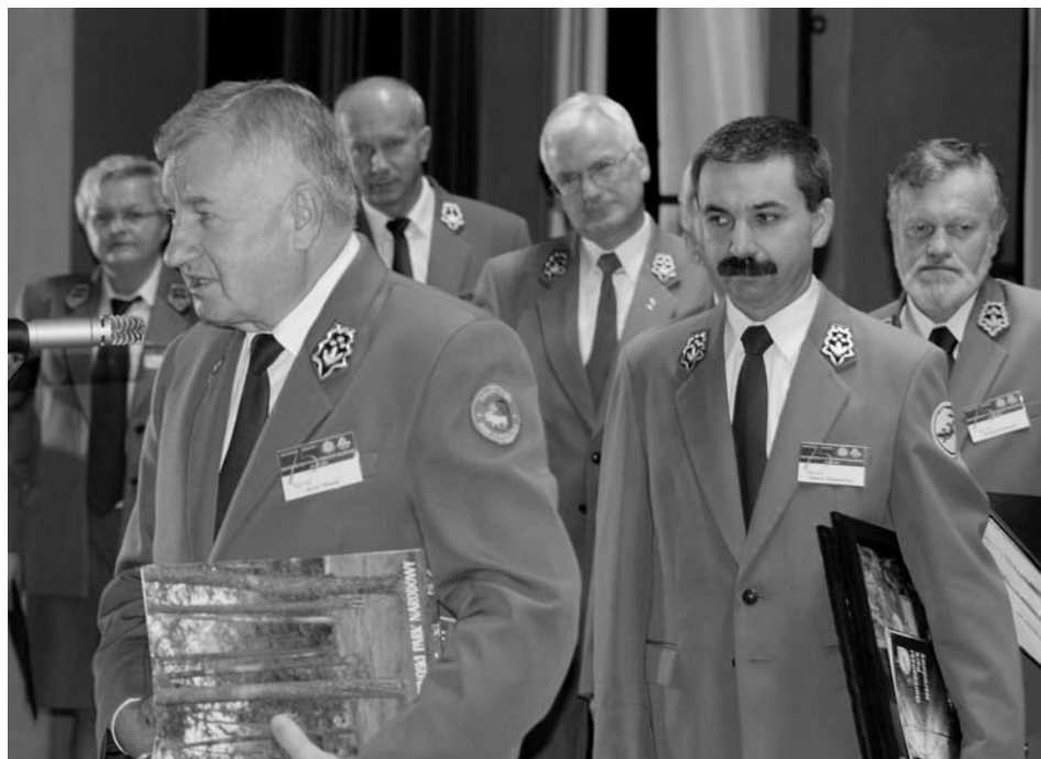
Fot. 5. Gratulacje od dyrektorów polskich parków narodowych. Congratulatory from the directors of national parks in Poland.